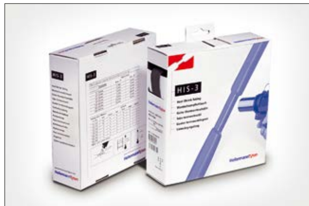
HIS-3 ist selbst bei großen Durchmesserunterschieden geeignet.